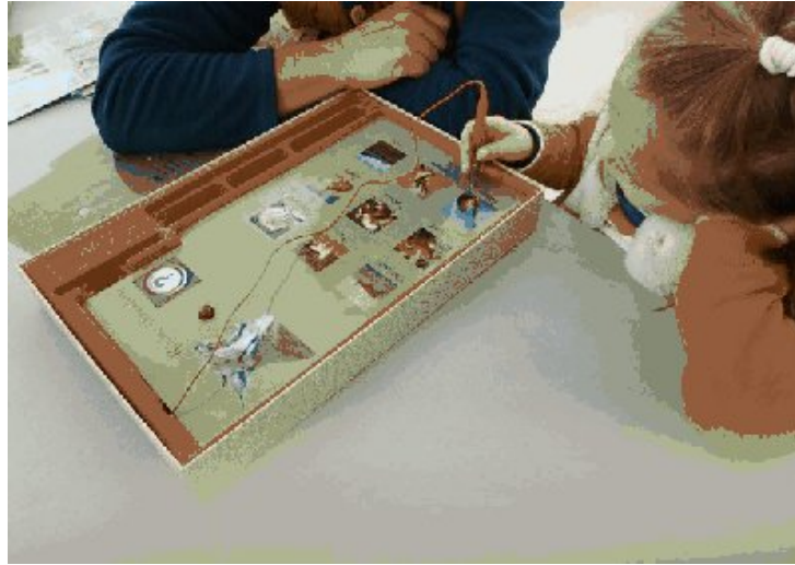
Un jeu sur le lynx