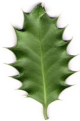
feuille de houx