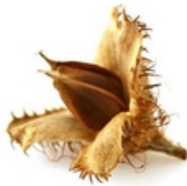
cupule de faine de hêtre

On a cherché des choses douces. On a trouvé de la mousse. Mia