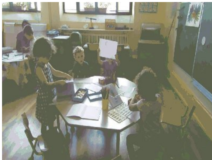
Atelier "mes histoires"