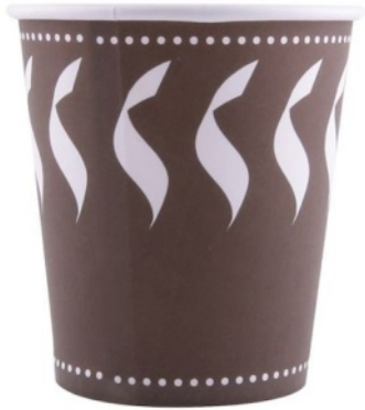
un gobelet en carton