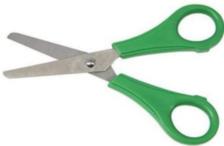
une paire de ciseaux